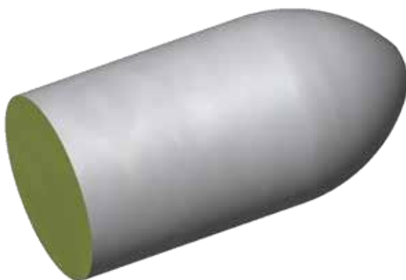
LDBS Низкая плотность Резиновое покрытие Легкая осушка