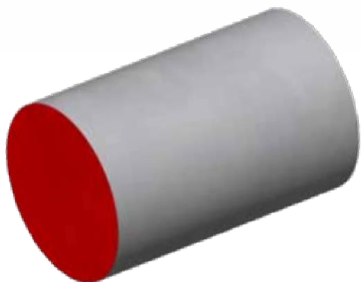
SLS Суперлегкий тампон Легкая осушка